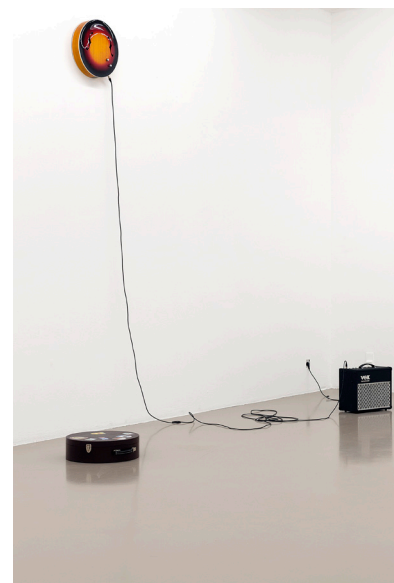
Saâdane Afif, Blue Time (Sun Burst) , 2004 Vue de l'exposition Saâdane Afif, Blue Time, Blue Time, Blue Time... 1er mars - 28 avril 2013, Institut d'art contemporain, Villeurbanne/Rhône-Alpes

Un son régulier émis par la caisse de résonance d'une guitare relié à un amplificateur. Au sol un étui portant les écussons des différentes villes où l'œuvre a été exposée.