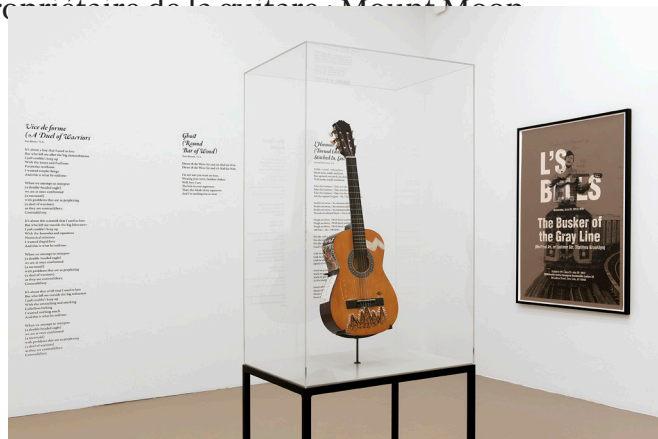
Saädane Afif, L'S BELLS - The Tool of Busker of the Gray Line , 2012 Vue de l'exposition Saädane Afif, Blue Time, Blue Time, Blue Time... 1er mars - 28 avril 2013, Institut d'art contemporain, Villeurbanne/Rhône-Alpes

Au mur les textes des chansons interprétées par le propriétaire de la guitare, Mount Moon