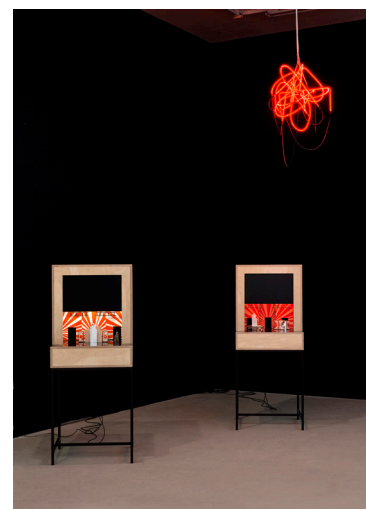
Vue de l'exposition Saâdane Afif, Blue Time, Blue Time, Blue Time... 1er mars - 28 avril 2013, Institut d'art contemporain, Villeurbanne/Rhône-Alpes

. Feedback : Blue Time versus Suspense (Stereo) , 2013