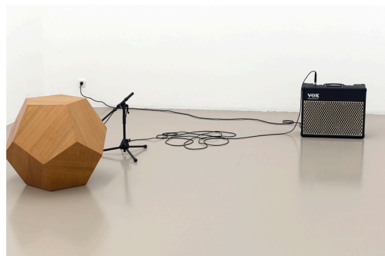
Saâdane Afif, Untitled (Blue Time, 2004 / Wood, Varnish, Amplificateur, Microphones, Cables / Diameter 35cm) , 2008 Vue de l'exposition Saâdane Afif, Blue Time, Blue Time, Blue Time... 1er mars - 28 avril 2013, Institut d'art contemporain, Villeurbanne/Rhône-Alpes