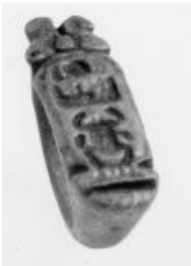
Bague sceau XXVIe dynastie : Date estimée de début ; XXXe dynastie : Date estimée de fin Egypte Collection Musée des Beaux Arts de Lyon