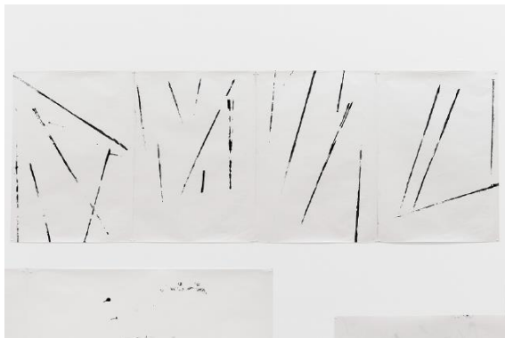
Georges ADILON 31.01.06, 2006, Peinture glycérophtalique sur papier couché brillant monoface. Peint côté mat et exposé côté mat Collection MAC Lyon © Georges Adilon