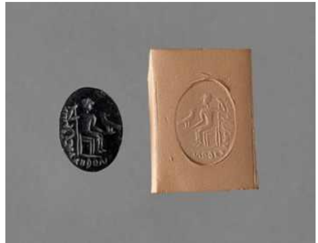
Intaille et empreinte 1er siècle av J.-C., 2e siècle av J.-C. Grèce antique (période) - période hellénistique