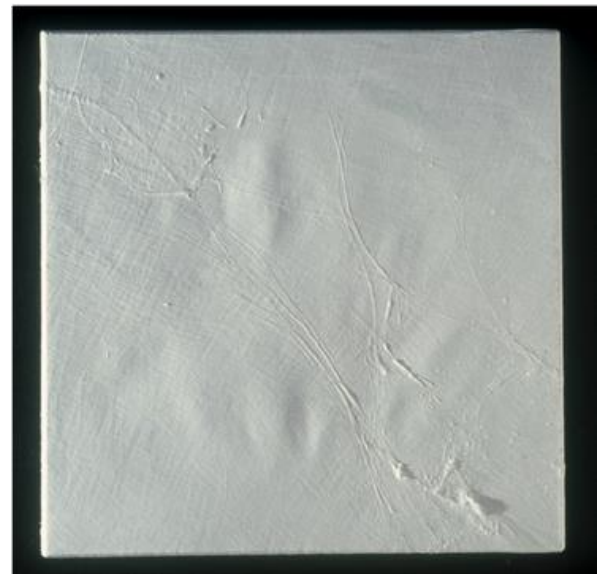
Philippe DROGUET Silastic, 3481, 1995

Moulages réalisés à partir d'un module de vessies tendues sur châssis de l'œuvre "Transhumance" - la surface de chaque pièce obtenue, moulée en silicone reproduit l'empreinte initiale