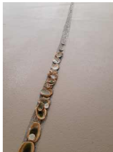
Kate NEWBY Wild was the night (détail), 2019 Verre, argent, bronze, céramique, béton coupé Exposition IAC Villeurbanne : OTIUM#4 2019

L'artiste est assise dans le véhicule pour une durée indéterminée, égrenant le nombre de tours par mégaphone.