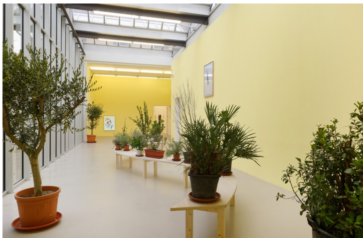
Chanson Florale , 2018 ; banc avec des plantes

Les artistes invitent le spectateur à parcourir cet espace ouvert sur l'extérieur. Des arbustes et des plantes sont disposés sur un module en bois où le visiteur peut s'installer et se laisser porter par la récitation des noms de plantes.