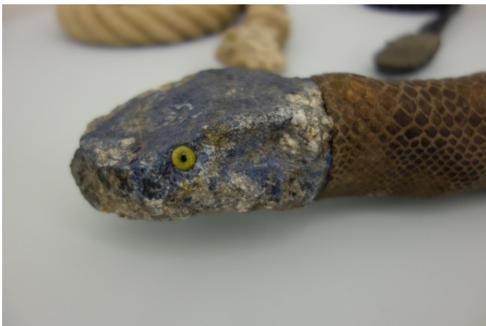
Jimmie Durham Five Snakes Stones , 2018, Pierre, bois, verre, chanvre, coton.

C'est un groupe de 5 sculptures de serpents dont chaque tête est en pierre et chaque corps composé par différents matériaux. Elles sont posées sur un socle-plateau de couleur bleu clair et à hauteur de taille.