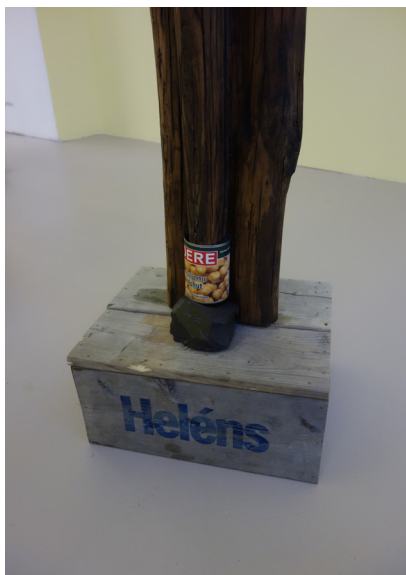
Helènes , sculpture de J Durham, bois de châtaignier, boîte de pois chiche, onyx, métal, papier

On pourra poursuivre avec l'observation de la sculpture de J Durham, Helènes