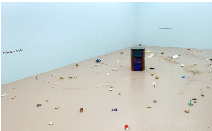
Mediterranean Sea , 2018, baril en acier inoxydable, eau, pierres, déchets : plastique, canettes, coton-tige...

Les artistes présentent une installation inédite : un baril contenant de l'eau de la Méditerranée semble flotter parmi des déchets disséminés à même le sol créant un paysage de désolation pouvant rappeler certains lieux côtiers.